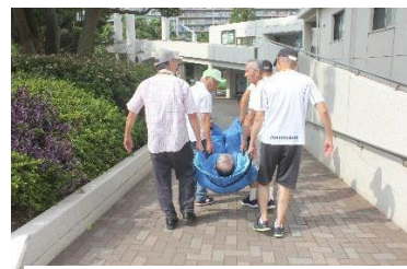
担架での救出訓練の様子

大地震、大規模火災等全戸に影響を及ぼす災害発生時に、住民の安全確保を目的に初動対応をおこなう自主防災組織です。21年度は60名 (自治会、管理組合、日常居住者で構成) の方をお願いしております。